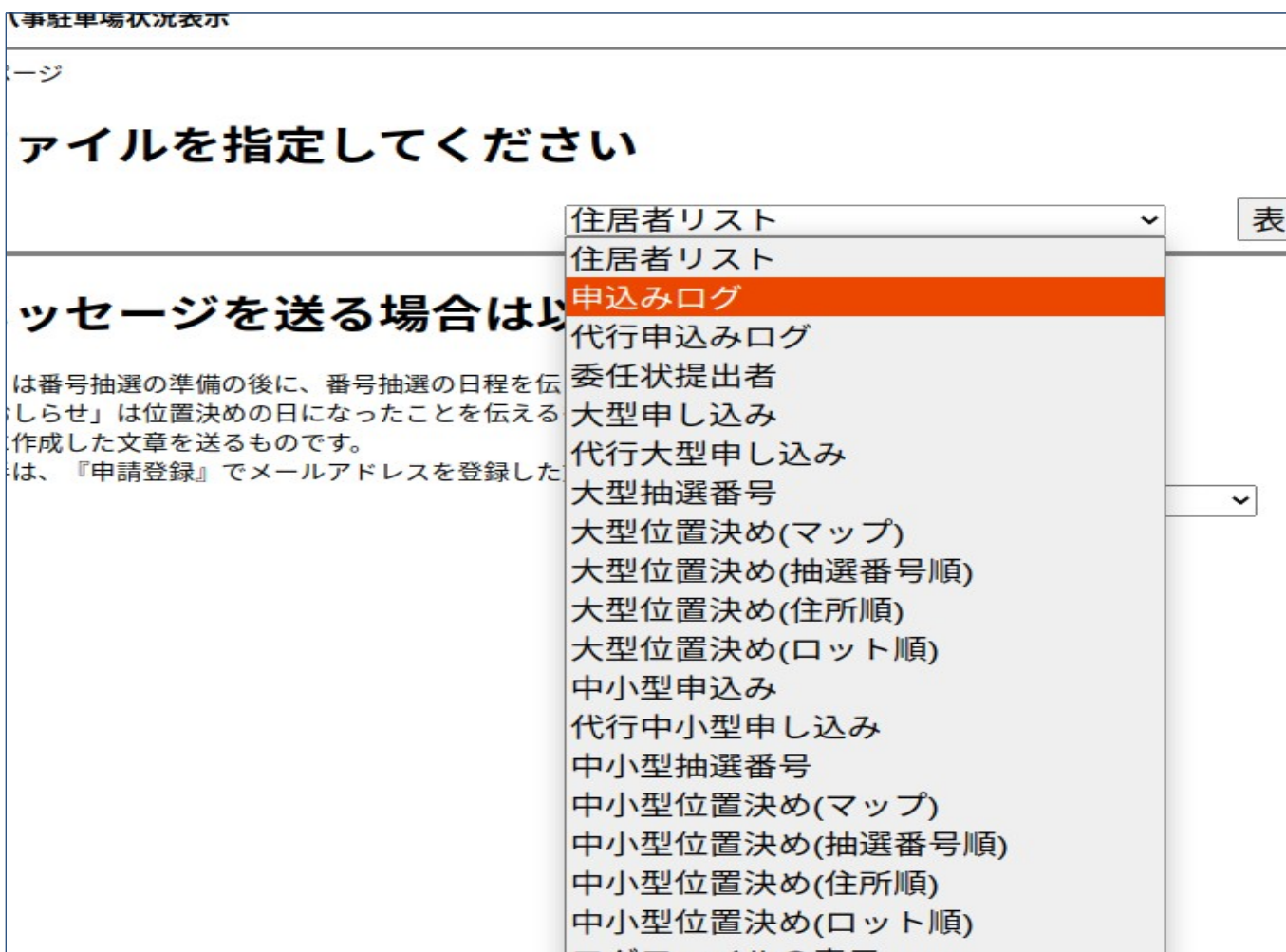
図 28. 管理用ファイルの表示のためのページ。いろいろな情報を得ることができる

上部の「表示」をクリックすると図 28 に示すようにメニューが現れる。(1)住居者リスト（パスワード一覧）、(2)申し込みログ（ウェブによる申請の時系列的記録）、(3)代行申し込みログ（代行による申請）、(4)委任状提出者(管理者が代行入力した委任状申請)、(5)大型申込み（(2)のうち大型の申込者のリスト）、(6)代行大型申込（(3)のうち大型の申込者のリスト）、(7)大型抽選番号(大型申込者で番号抽選した者の番号順リスト、およびウェブで抽選した者には位置決めをウェブで行うかどうかのアンケート情報をつけている（Y はウェブで行う、N は行わない、U は未定））、(8~11)大型の位置決め者のリスト(抽選番号順、住所順、ロット順、図表示)、(12~18)中小型における(5~11)に対応する情報。このうち(「大型抽選番号」と「中小型抽選番号」は位置決め当日に必要な情報であり、それをクリックすると CSV 形式のファイルもダウンロードできる。